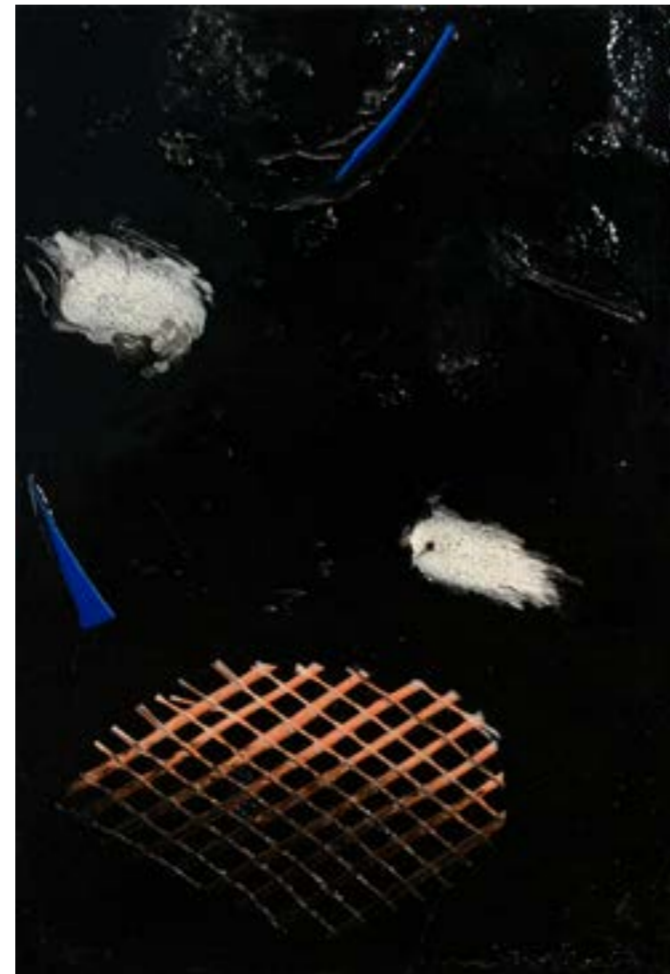
Irmak Canevi, Entertorse Atılan, 12x17,5 cm, 2016, Afcı, plastik deterjan şişesi parçaları, ev boyası ve tuval tahtası üzerine yağlı boya için takviye filesi