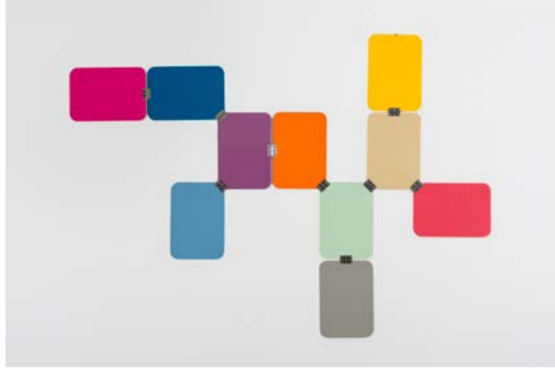
Ayşe Erkmen, Pantone 1, 2014 Boyanmış alüminyum plakalar, 156 x 219 cm