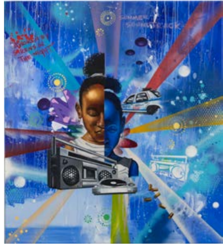
Chris Daze Ellis, Summer Soundtrack, 2015 Tuval üzerine akrilik, yağlı ve spreyl boya 91,44 x 101,6 cm

Sevil Dolmacı İstanbul, Artweeks İstanbul'un 10. edisyonunda hem yurtiçi ve yurtdışında tanınan hem de gelecek vaat eden başarılı 11 Türkiye'li ve 5 uluslararası sanatçının eserlerinden oluşan seçkisiyle sanatseverle buluşuyor. Amerikalı grafiti sanatçısı ve ressam DAZE Ellis bu isimlerden biri. 1980'lerde Andy Warhol tarafından desteklenen ve metrolardan stüdyoya başarılı bir geçiş yapan az sayıdaki sanatçıdan bir tanesi olan