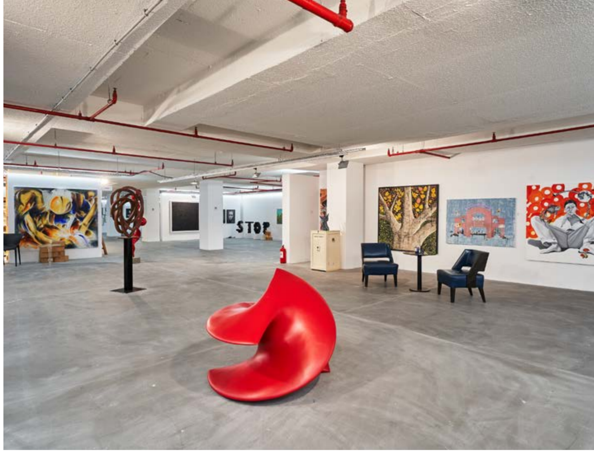
Artweeks İstanbul IX'dan görünüm, MERKUR