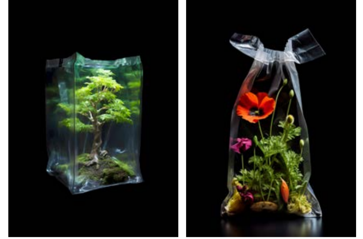
İlgin Seymen, İş Günleri, 2024. Diasec, 68,5x50 cm, 3+1 ap. İlgin Seymen, Koruma Çabaları, 2024. Diasec, 48x35 cm, 3+1 ap.

İlgin Seymen Koruma Çabaları ve İş Günleri isimli, yapay zekâ ile metinden ürettiği yeni serilerinde, yaşamın çoktan metalaştığı, her alanda endüstrileşen, teknoloji ağırlıklı modern dünyada,