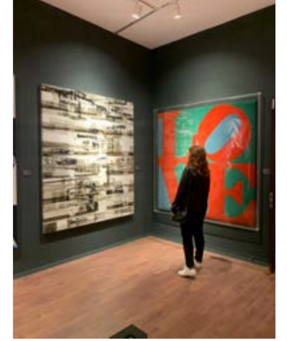
Artweeks İstanbul'un eski edisyonlarından görüntüler

hareketlerle el ele yürümüş-tür. Günümüz dünyasında, dijitalleşme ve küreselleşme gibi olguların sanat üzerindeki etkilerini nasıl değerlendiriyorsunuz? Sizce bu gelişmeler, sanatçıların ifade biçimlerinde veya sanatın algılanışında kalıcı bir değişiklik yaratacak mı? Dijitalleşme gündelik hayatın pratiklerine etki etmeye başlayan uzun zaman oldu. Hayata etki eden her şey de zaman içinde sanatta beliriyor. Bir araç ve medyum olarak dijital sanatın etkisi genişliyor. Dijital sanatçılar olarak kategorize edilen bir alanları var üstelik. Dolayısıyla bu etkinin kalıcı olduğunu görebiliyoruz. Ayrıca İnternet ve dijital teknolojilere bağlı belgeleme, paylaşma alanları- en başta sosyal medyayı örneklendirebiliriz, eskiden yalnızca fiziksel iletişimle kavranabilen sanat eserlerinin daha geniş kitlelere ulaşmasına olanak veriyor: Orada değilken de orada olabilmek. Dijital sergilemeler sanatsal faaliyetlerin etkin alanlarından birine dönüştü. Tabii bu durumun sanatta beliren hiçbir yenilik bir öncekine tehdit oluşturmuyor bence. Yıllardır konuşulan fotoğrafın ve diğer birçok medyumun artık resmin yerini alacağı önermeleri yan-