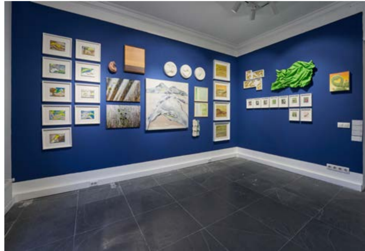
Artweeks İstanbul VIII'den görünüm