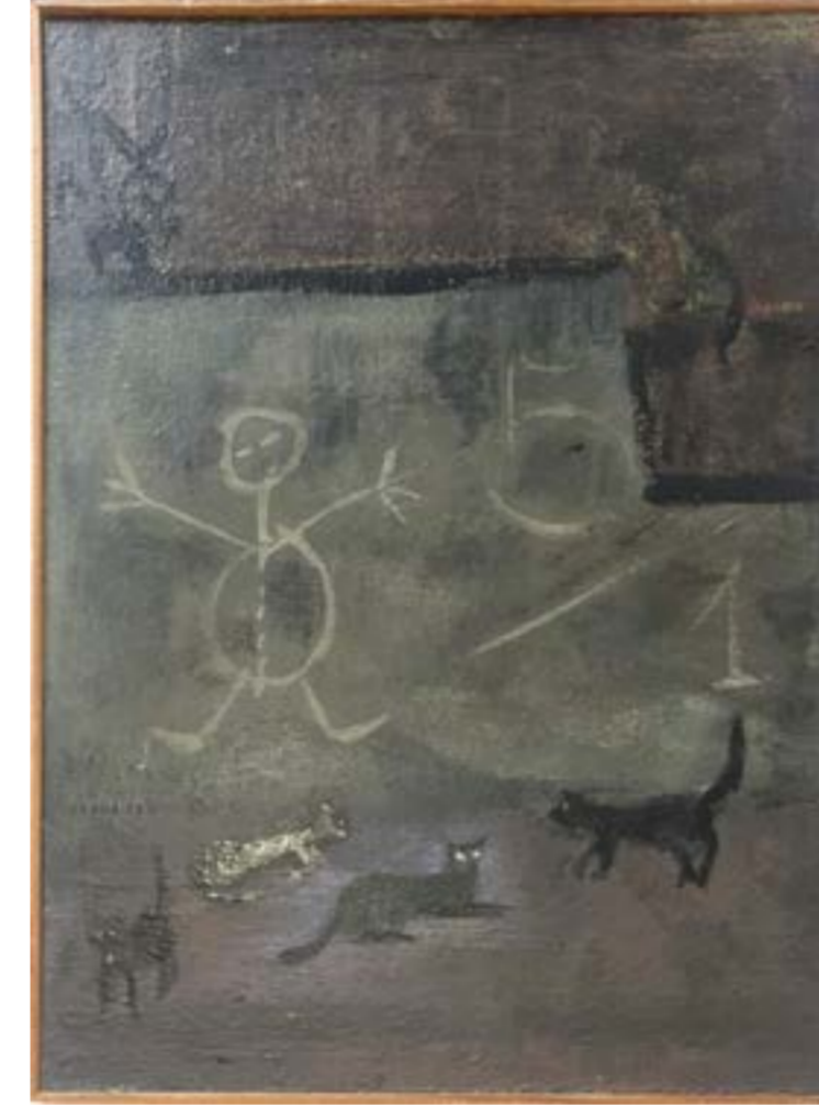
Selim Turan, Selim, Seza Paker'in izniyle