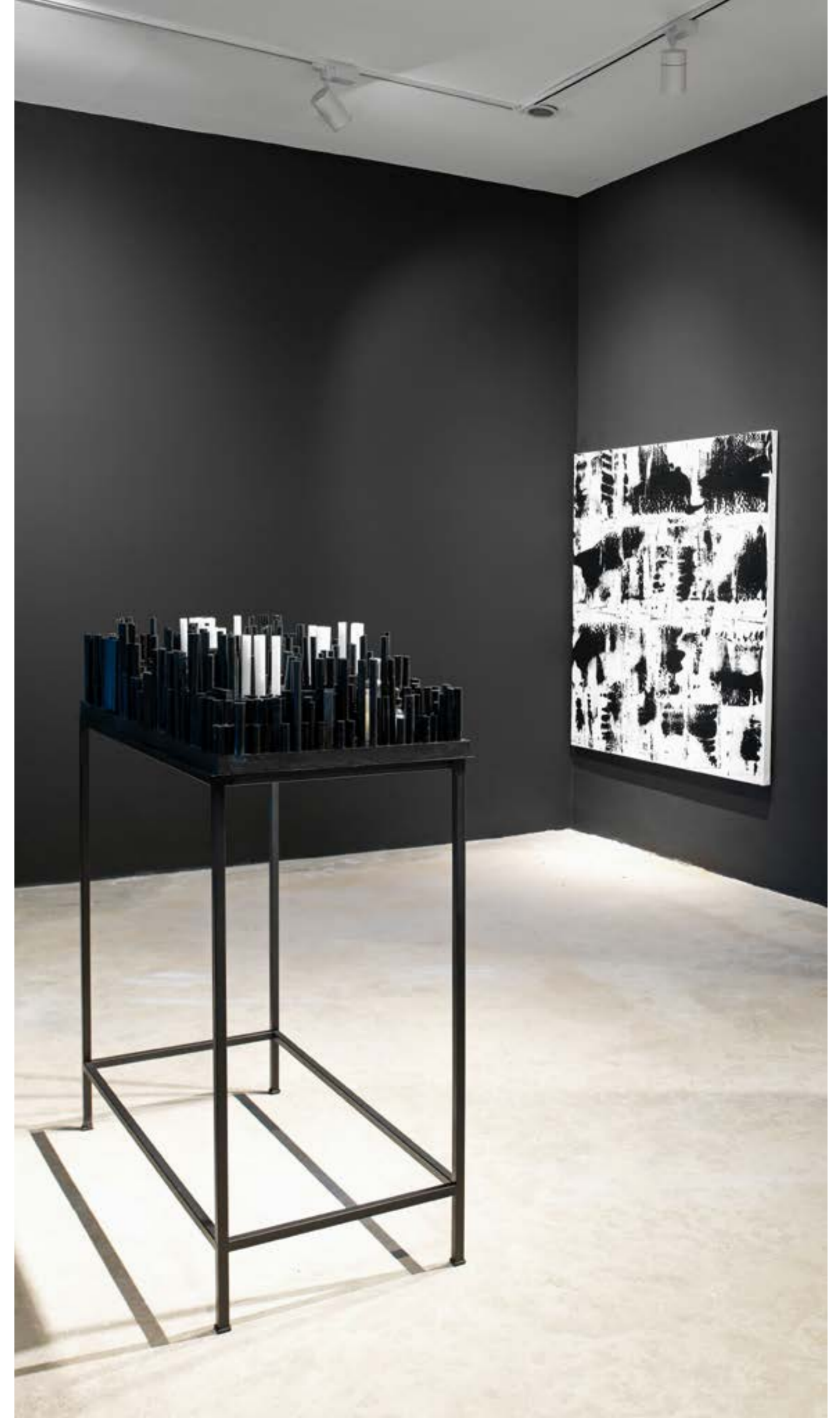
(Solda) Şerife Bilgili Ercantürk, İsmisiz 6, Delirin plaka üzeri yerleştirilmiş, delirin çubuk, şişe ve iğne 50 x 100 cm, 2023 (Sağda) Şerife Bilgili Ercantürk, İsmisiz 3, Tuzal Üzeri Akıllık Boya, 150 x 150 cm, 2023