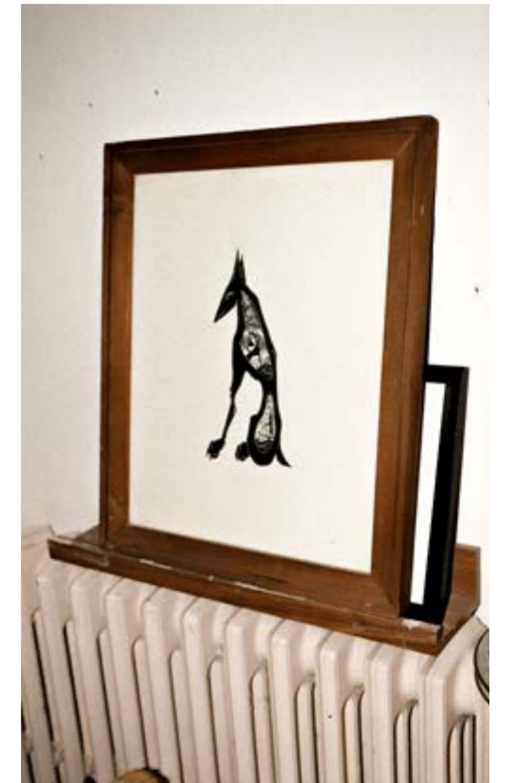
Eymen Aktel, Untitled, 2021, Kâğıt üzerine mürekkep, 42cm x 34cm