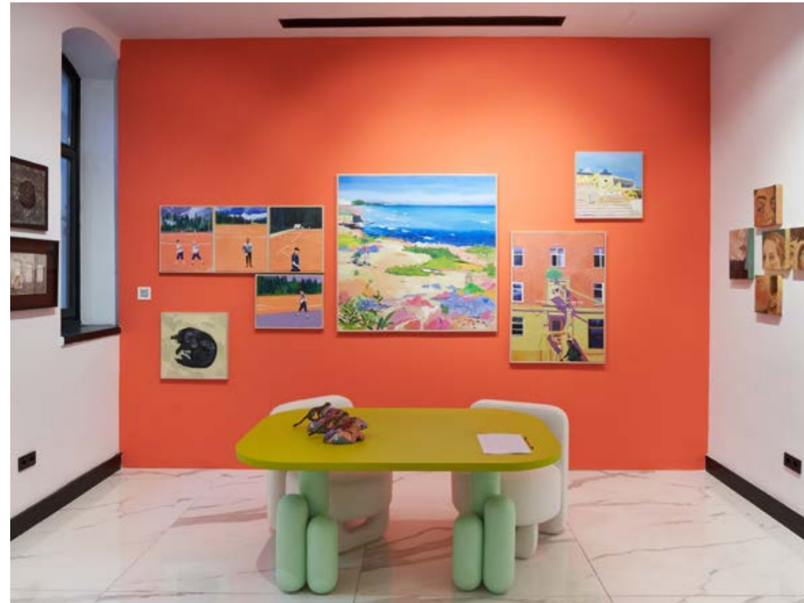
Artweeks İstanbul IX'dan görünüm, Martch Art Project