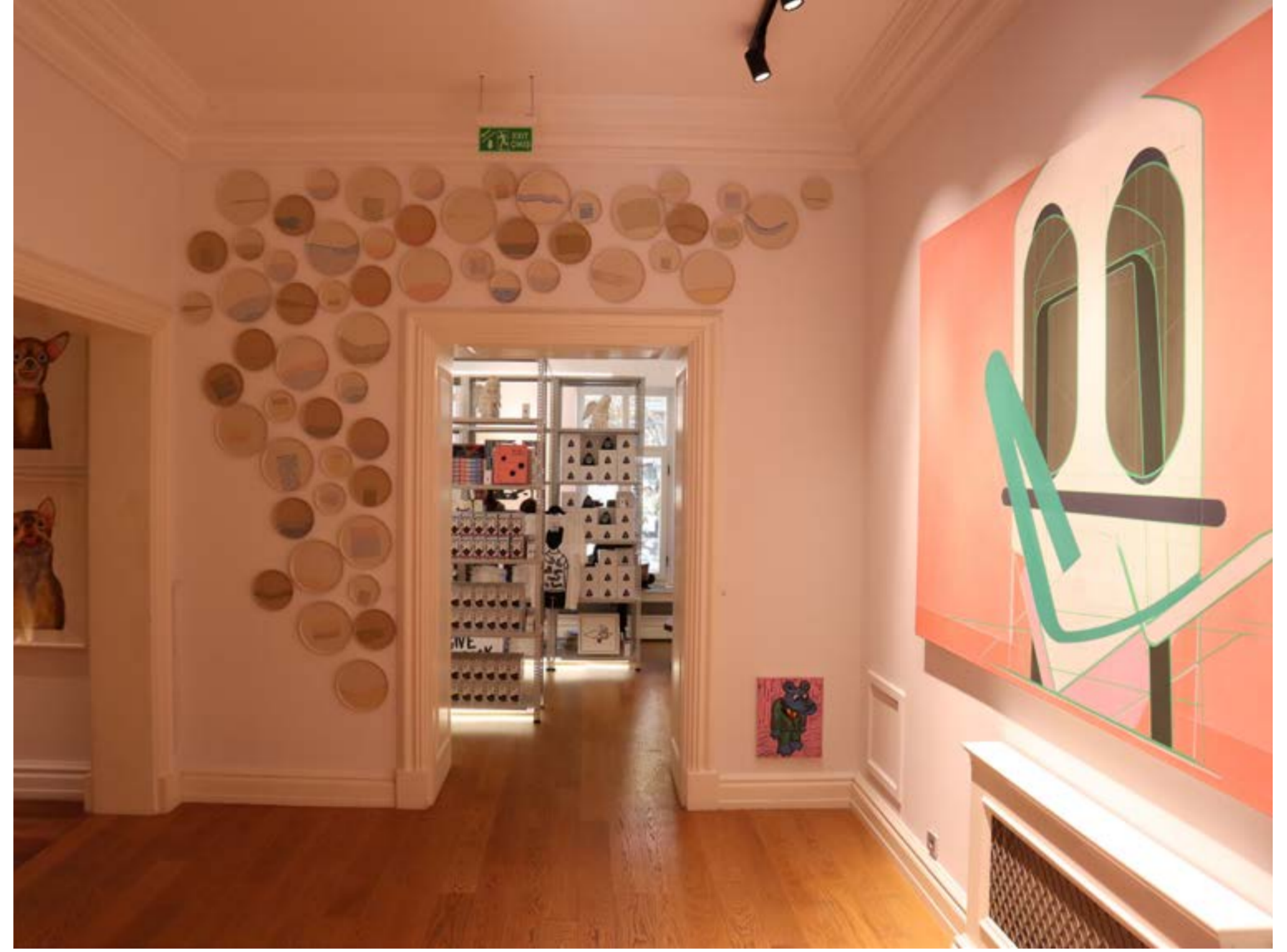
Artweeks İstanbul VII'den görünüm

makta. Bu nedenle; koleksiyoncuların bu sorumlulukla bilinçli eser alımı yapmaları ve gerektiği aşamalarda uzman bir danışmandan faydalanmaları- önemli bir detay. Sanat eseri alımındaki diğer önemli unsur ise satın alınacak eserin orijinal olmasına gösterilecek dikkat ve eserlerin nereden temin edileceği sorunsalı. Koleksiyona dâhil olacak yeni eserlerin sanat galerileri, sanat fuarlarından edinilmesi alıcıları bu sorunsalın tehlikelerinden de koruyor. Koleksiyonerlerin özellikle pandemi sonrasında yaygınlaşan ve marka güvenilirliği olmayan sosyal medya müzayedelerinden uzak durmaları da diğer inceliklerle dikkat edilmesi gereken unsurlar arasında olmalı. Koleksiyonların görünür olma sorunu da var. Tüm koleksiyonlar sergiler ile mi görünecek? Müzeler buna aracı